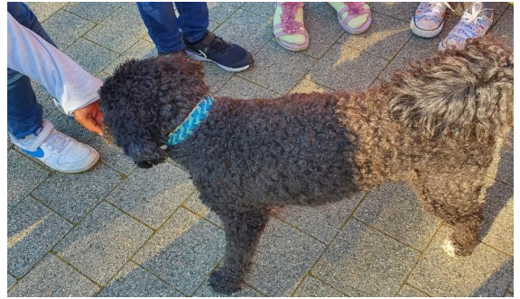
Dafür bekommt Socke natürlich ein Leckerli. So macht man es richtig!