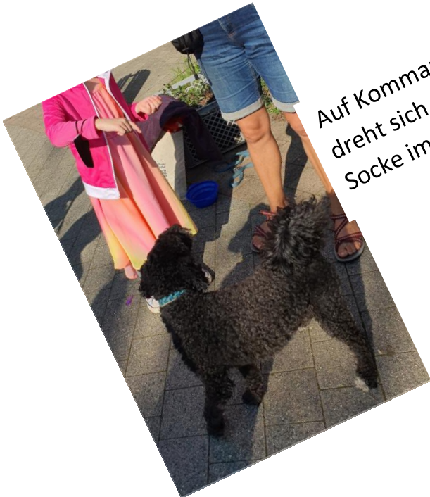
Auf Kommando dreht sich Socke im Kreis.