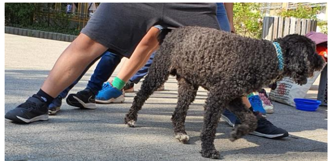
Wir machen einen Tunnel und Socke läuft hindurch. Spitze!!!