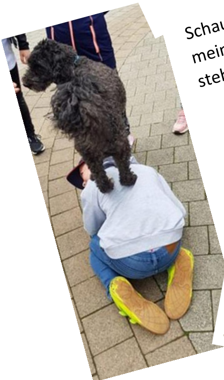
Schau mal! Auf meinem Rücken steht Socke!